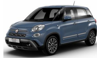
код фарби 652