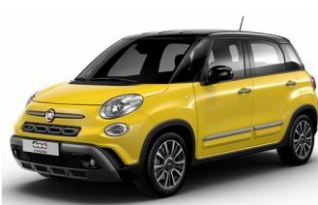
код фарби 828