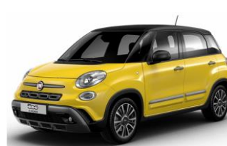
код фарби 970