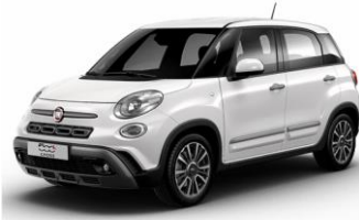
код фарби 268