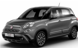
код фарби 609