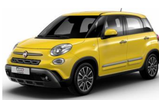
код фарби 830