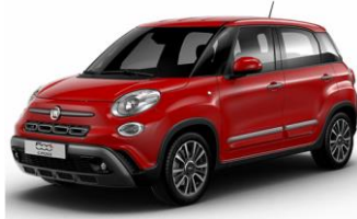
код фарби 111