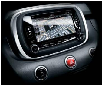
6,5" кольоровий сенсорний екран з навігацією і магнітою, MP3, DAB, без CD