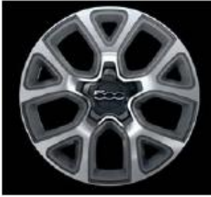
Легкосплавні колісні диски 215/55 R17 (433)