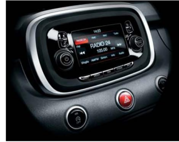
5" кольоровий сенсорний екран з магнітою, MP3, радіо AM/FM1, без CD