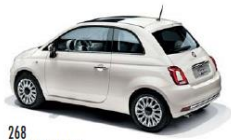
268 BIANCO GELATO