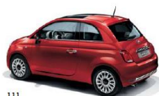
111 ROSSO PASSIONE