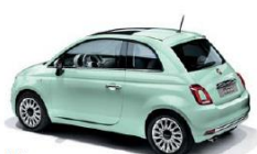
166 VERDE LATTEMENTA