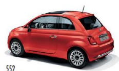
552 ROSSO CORALLO