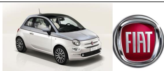
FIAT 500 DolceVita

м. Львів ТЗДВ „ПЛАСТИК”, вул. ЗЕЛЕНА 149 тел. 244-22-22, 270-27-18 www.fiat.lviv.ua