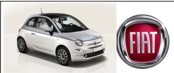
FIAT 500 DolceVita

м. Львів ТЗДВ „ПЛАСТИК”, вул. ЗЕЛЕНА 149 тел. 244-22-22, 270-27-18 www.fiat.lviv.ua