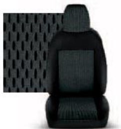
STAR GRIGIO 213