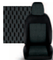
STAR GRIGIO 213