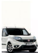
249 - BIANCO