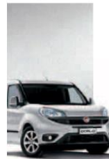
612 - GRIGIO CHIARO