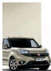
261 - PERLA