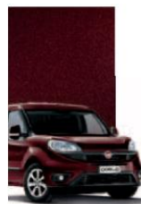
590 - BORDEAUX