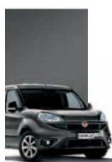
695 - GRIGIO