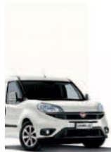
249 - BIANCO