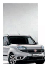
612 - GRIGIO CHIARO