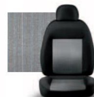
PIN STRIPE GRIGIO 223