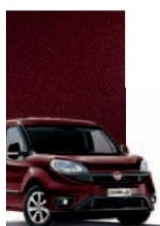
590 - BORDEAUX