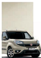
261 - PERLA