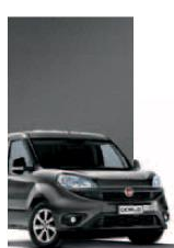
695 - GRIGIO