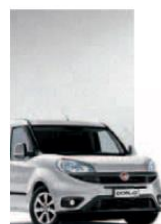
612 - GRIGIO CHIARO