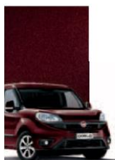
590 - BORDEAUX