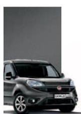
695 - GRIGIO