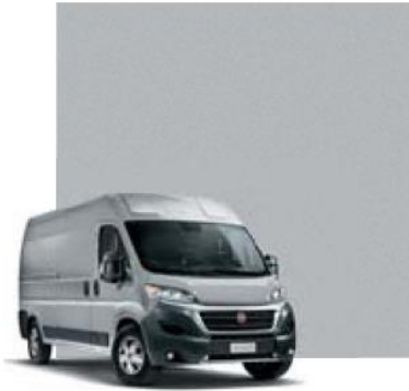
611 Grigio Alluminio