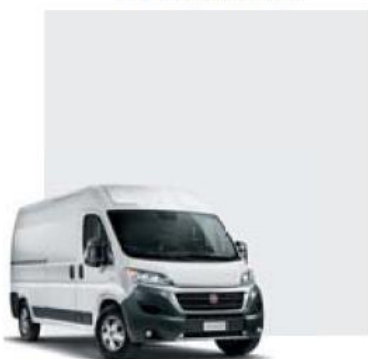
549 Bianco Ducato