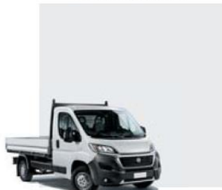
549 Bianco Ducato

Забарвлення кузова пастельною фарбою (колір білий)