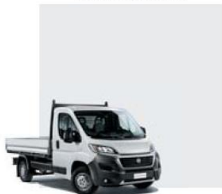
549 Bianco Ducato

Забарвлення кузова пастельною фарбою (колір білий)