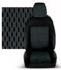
STAR GRIGIO 213