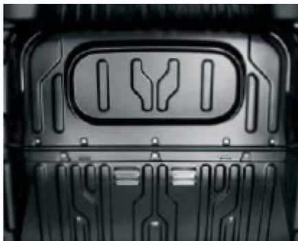
Глуха перегородка для версії з 3-х місним салоном