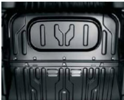
Глуха перегородка для версії з 3-х місним салоном