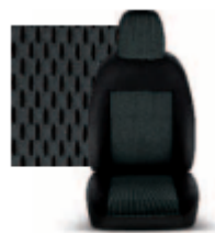
STAR GRIGIO 213