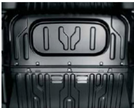
Глуха перегородка для версії з 3-х місним салоном