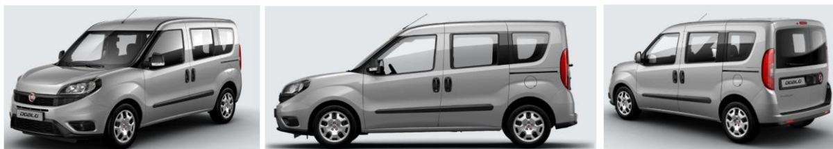
Забарвлення кузова фарбою металік (код 695)