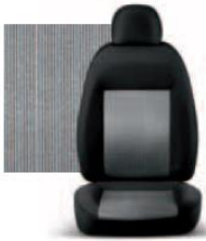
PIN STRIPE GRIGIO 223