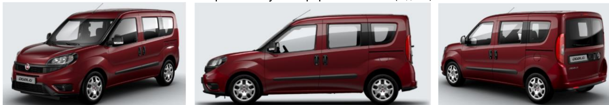
Забарвлення кузова фарбою металік (код 448)