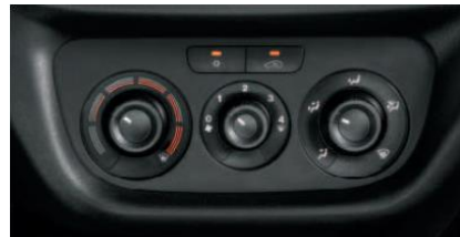
Кондиціонер з ручним регулюванням