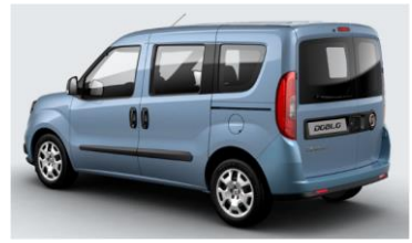
Забарвлення кузова фарбою металік (код 612)