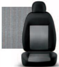
PIN STRIPE GRIGIO 223