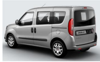
Забарвлення кузова фарбою металік (код 695)