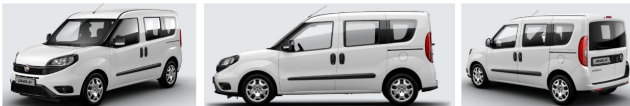
Забарвлення кузова фарбою металік (код 293)