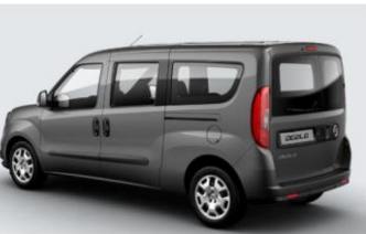
Забарвлення кузова фарбою металік (код 722)