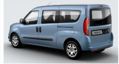
Забарвлення кузова фарбою металік (код 612)