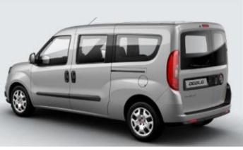
Забарвлення кузова фарбою металік (код 695)