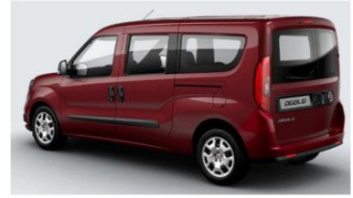
Забарвлення кузова фарбою металік (код 448)