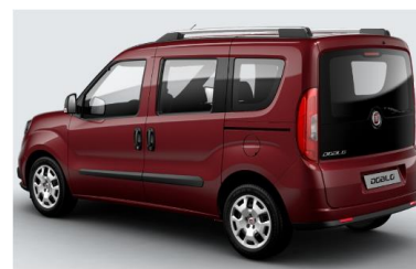
Забарвлення кузова фарбою металік (код 444)