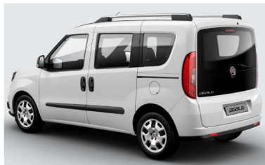
Забарвлення кузова фарбою металік (код 293)