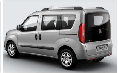
Забарвлення кузова фарбою металік (код 695)