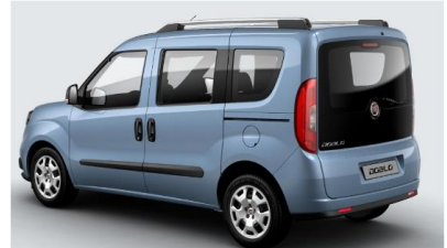
Забарвлення кузова фарбою металік (код 612)