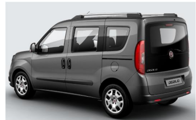
Забарвлення кузова фарбою металік (код 722)