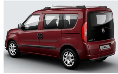
Забарвлення кузова фарбою металік (код 448)