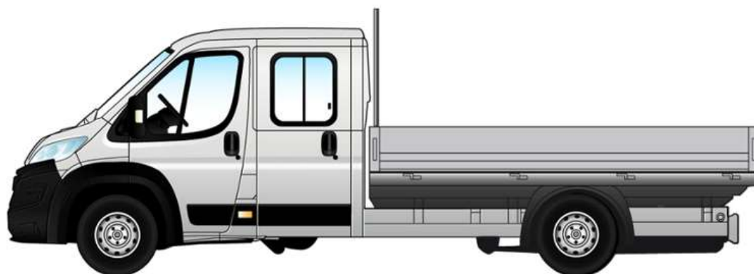
Габаритні розміри та розміри вантажного відділення, мм

Забарвлення кузова пастельною фарбою білого кольору (код 549 – DUCATO BIANCO)