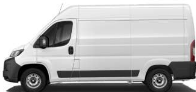
Габаритні розміри, мм

Забарвлення кузова пастельною фарбою білого кольору (код 549 – DUCATO BIANCO)