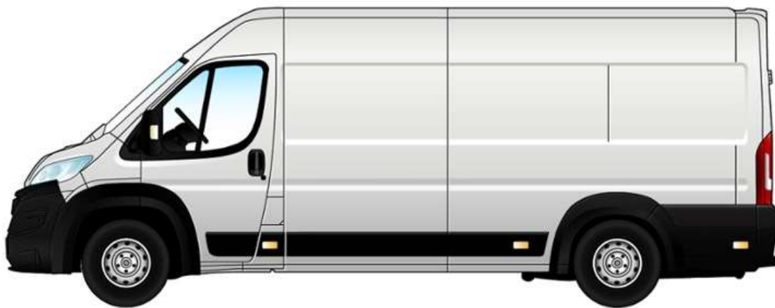
Габаритні розміри, мм

Забарвлення кузова пастельною фарбою білого кольору (код 549 – DUCATO BIANCO)