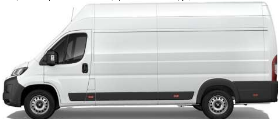
Габаритні розміри, мм

Забарвлення кузова пастельною фарбою білого кольору (код 549 – DUCATO BIANCO)