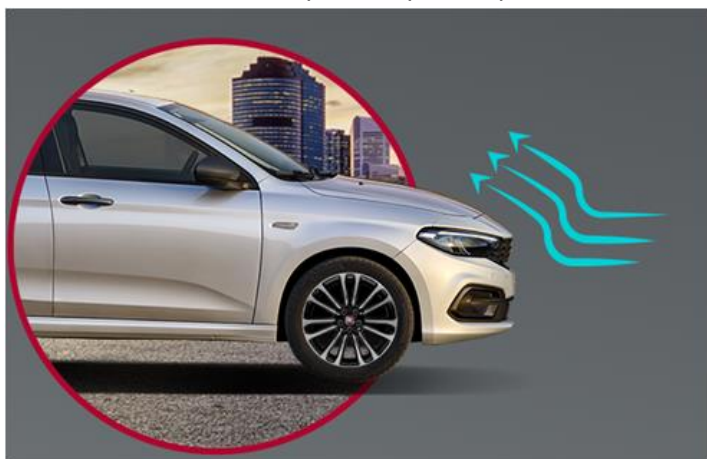
Активна заслонка решітки радіатора