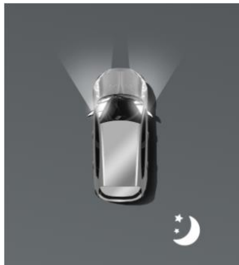
Автоматичне дальнє світло