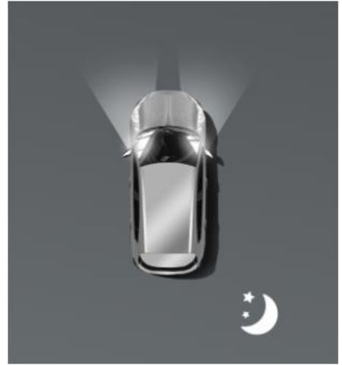
Автоматичне дальнє світло