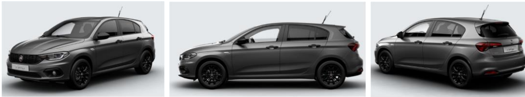
Забарвлення кузова фарбою металік (код 651)