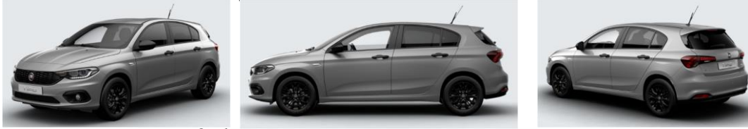
Забарвлення кузова фарбою металік (код 695)