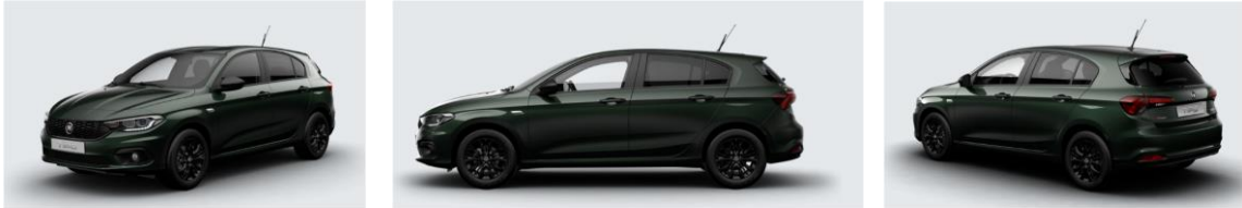
Забарвлення кузова фарбою металік (код 716)