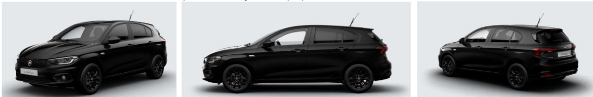
Забарвлення кузова фарбою металік (код 722)