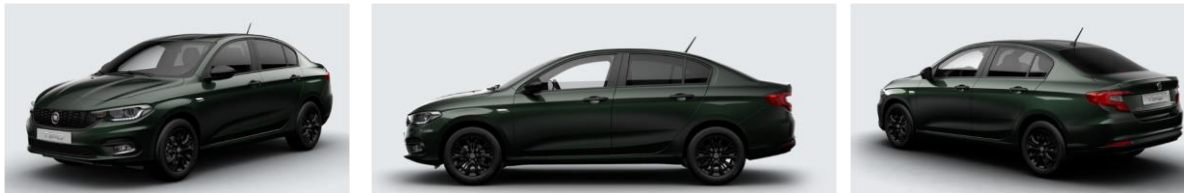
Забарвлення кузова фарбою металік (код 695)