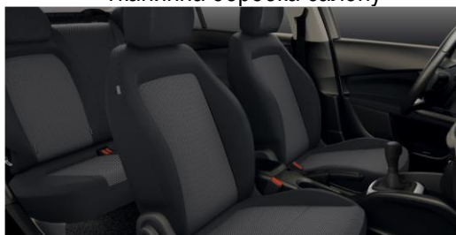
Тканинна обробка салону