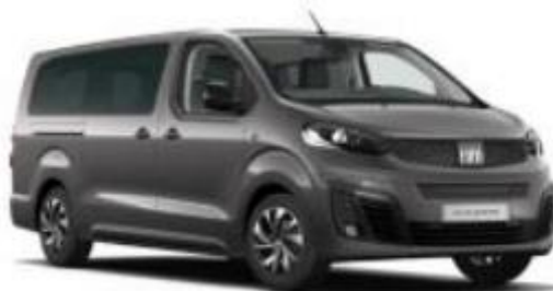
Габаритні розміри, мм

Забарвлення кузова фарбою металік темно сірого кольору 6FW (код VR-691/A Grigio scuro metallizzato)