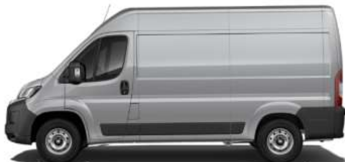
Габаритні розміри, мм

Забарвлення кузова пастельною фарбою сірого кольору (код 113 – GRIGIO ARTENSE)